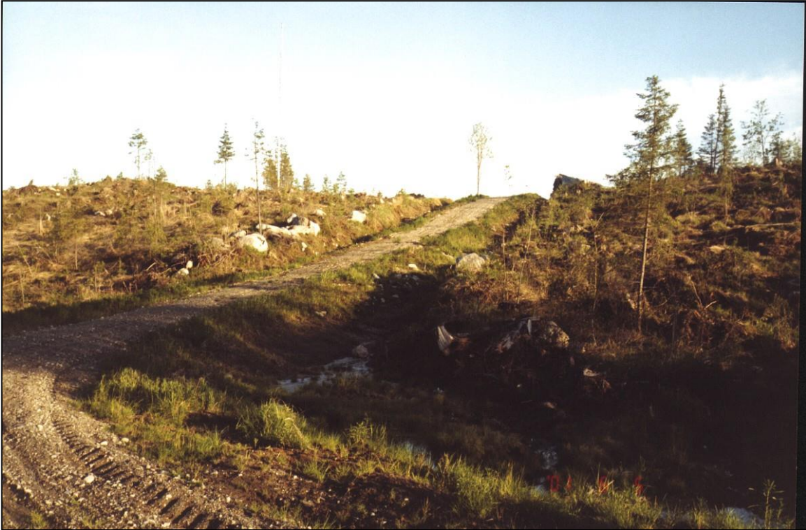
Asuinpaikka mäen laella tien vasemmalla puolen. Kuvattu etelään.