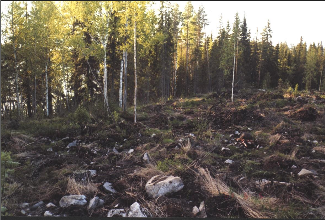
Asuinpaikkatasannetta. Kuvattu pohjoiseen.