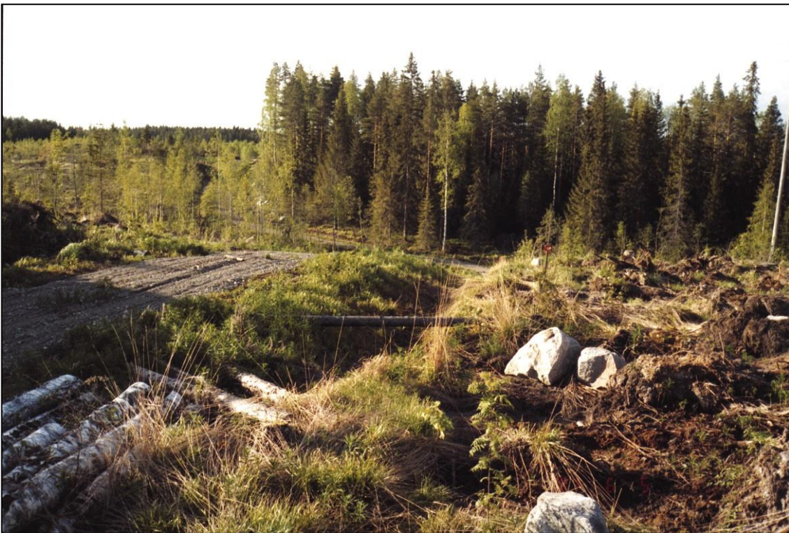
Asuinpaikka kuvan etualalla tien oikealla puolen. Kuvattu pohjoiseen.