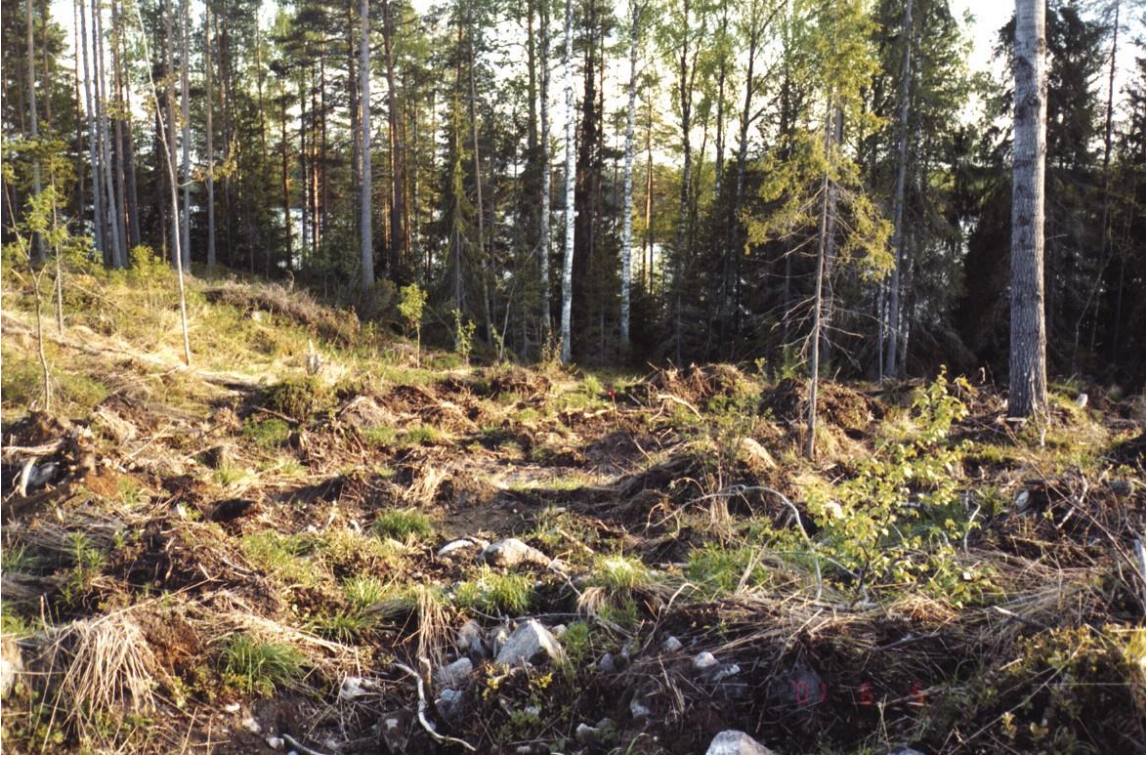
Asuinpaikka rinteän juurella Haavan ympärillä ja sen takana. Kuvattu lounaaseen, rannan suuntaan.