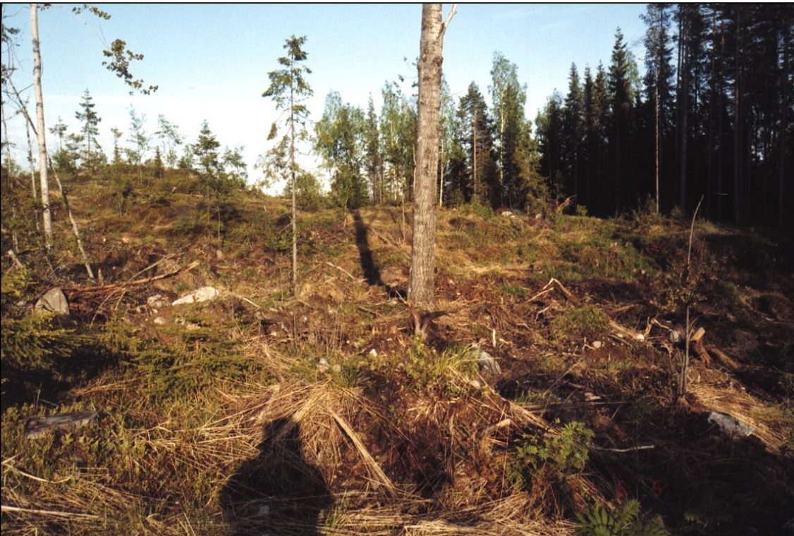
Asuinpaikkatasannetta kuvan keskellä. Kuvattu kaakkoon.