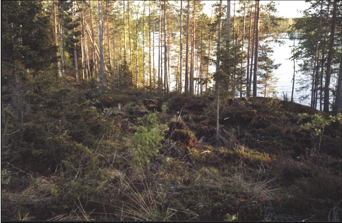
Asuinpaikkatasanne mäen juurella olevalla tasanteella. Kuvattu etelään.